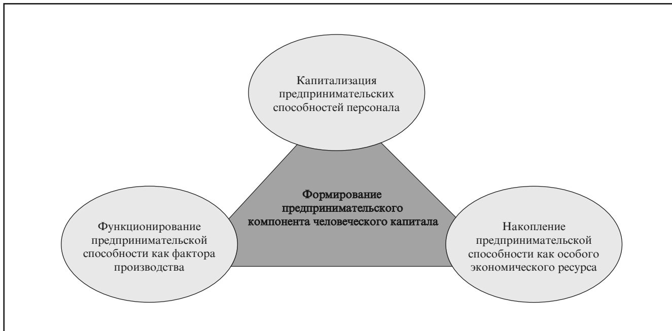
Рис. 2. «Магический треугольник» превращения предпринимательских способностей в человеческий капитал (разработка авт.)

1. Накопление предпринимательских способностей как особого экономического ресурса. В состав данного ресурса следует включать, прежде всего, собственно предпринимателей, всю предпринимательскую инфраструктуру страны, а также предпринимательскую этику и культуру. В целом предпринимательский ресурс можно охарактеризовать как особый механизм реализации предпринимательских способностей людей, основанный на действующей модели рыночной экономики.